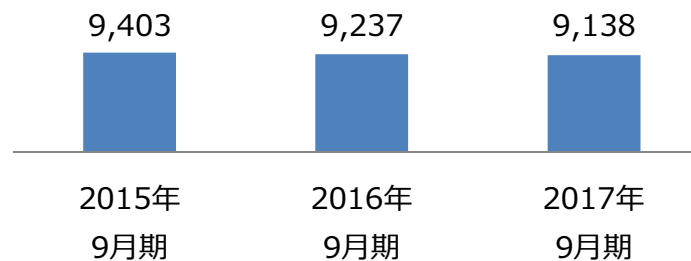
【ご参考】売上高の推移（単位：百万円）